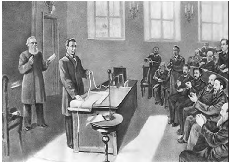
Олександр Попов демонструє можливості свого радіоприймача

Радіозв'язок є результатом дивовижного винаходу кінця 19 століття. 7 травня 1895 року російський вчений Попов вперше продемонстрував передачу інформації шляхом радіосигналу. Цей винахід досить швидко почали застосовувати для покращення комунікації та прискорення передачі інформації. Від того часу минуло 120 років, але нам важко уявити життя без радіо, ТБ, Інтернету, або мобільного зв'язку. Ми бачимо, що сфера комунікацій розвивається досить швидко. Добре це чи погано? Звичайно, ми за прогрес. І якщо це на добро людини, чому ні?